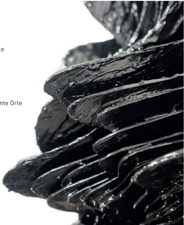
Abbildung: MLCL VI, Skulptur, 2021-2022. Polycarbonat, Sperrholz, Stahl, Farbe, 72x28,5x180 cm