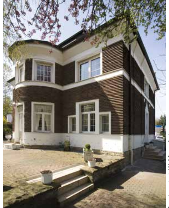
Eppenhäuser Straße 136, © Thomas Seuthe

Bei dem Rundgang rund um das „Stirnband“ in Hagen-Eppenhäuser zeigen die Ludwigs-Villenbauten die Entwicklung von den Jugendstiltendenzen über den Expressionismus bis hin zur Versachlichung.