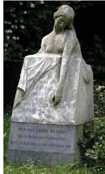
Grabmalgestaltung von George Minne

Von Historismus über Jugendstil bis in die Moderne – jede Zeit hat ihre Spuren hinterlassen. Der Rundgang über den Buschey Friedhof gibt Einsichten in die Hagener Stadtgesellschaft mit ihren Familiendynastien sowie in die Entwicklung der Friedhofsästhetik und Grabmalkultur.